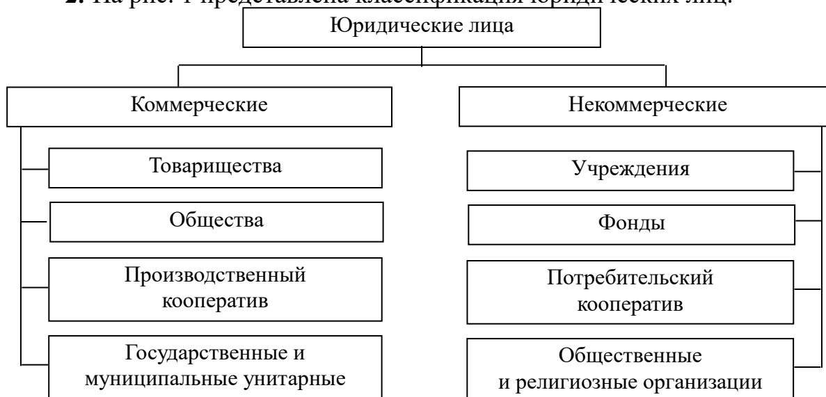
Рис. 1. Классификация юридических лиц

2. На рис. 1 представлена классификация юридических лиц.