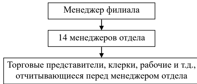
Рис. 3. Второй вариант структуры

В каких условиях структуры наиболее эффективны? Аргументируйте свой ответ.